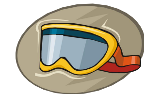
tóu kǎi 头盔 helmet hù mù jìng 护目镜 goggles