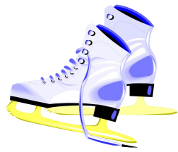
liú bīng xié 溜冰鞋