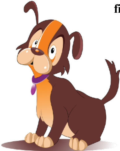
el perro dog