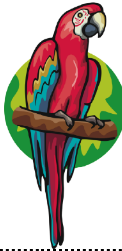
el pájaro bird